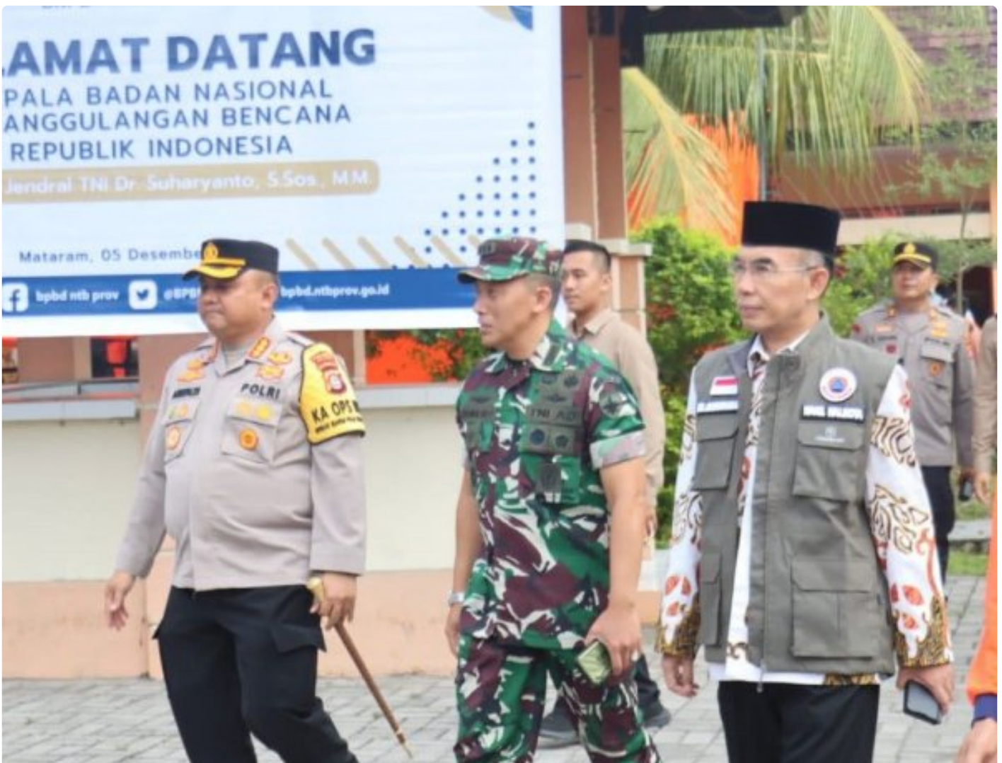
Kapolresta Mataram (Kiri) saat menghadiri acara Peletakan batu Pertama pembangunan gedung Pusdalops BPBD NTB, Kamis (05/12/2024)