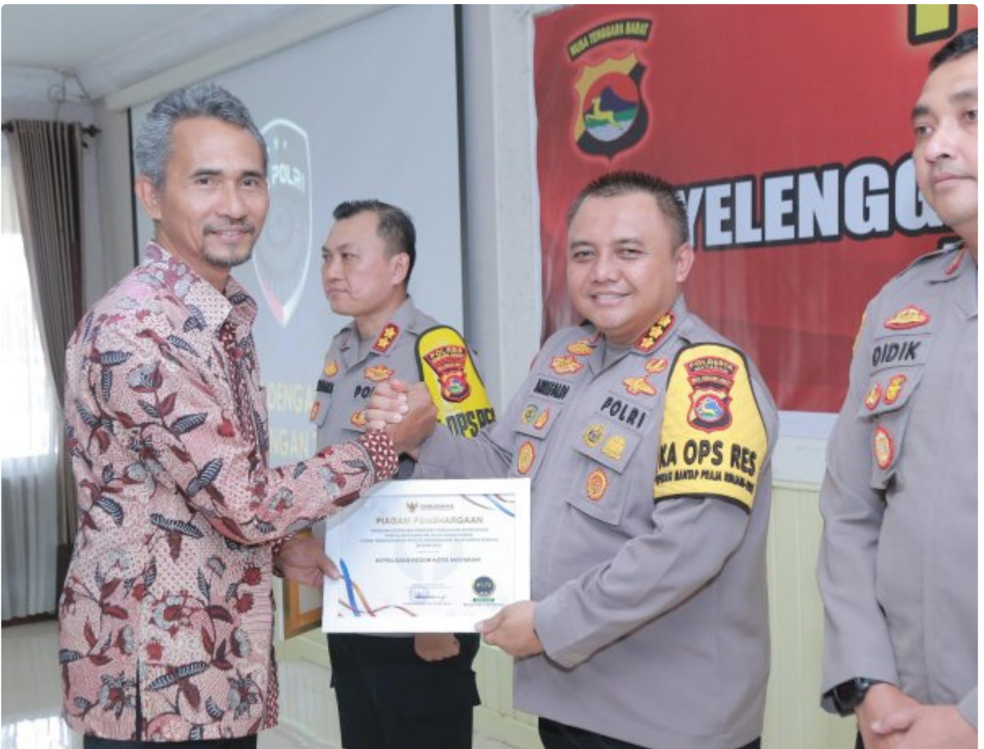
Kapolresta Mataram saat menerima Penghargaan dari Ombudsman RI perwakilan NTB, Kamis (19/12/2024)

MATARAM, NTB – Polresta Mataram kembali mengukir prestasi dengan meraih Predikat Kepatuhan Penyelenggaraan Pelayanan Publik Tahun 2024 dari Ombudsman NTB. Polresta Mataram menjadi salah satu dari delapan Polres/ta